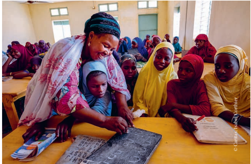
▲ Een van de goed gevulde klassen van het vormingscentrum van Adjekoria. Elk jaar volgen er 130 vrouwen een cursus.

“Ik ben heel trots op hen” “Vroeger zagen we geen uitkomst”, gaat Ouma verder. “In heel wat