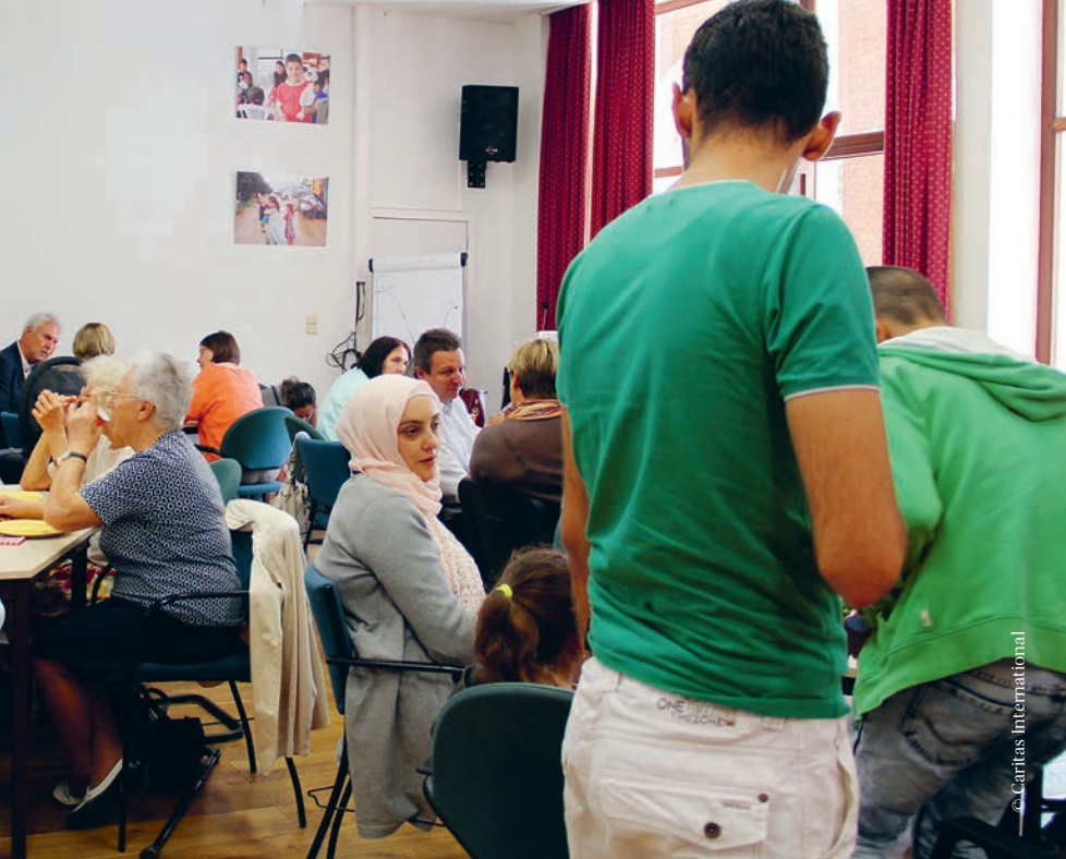
▲ Onthaalgroepen, vluchtelingen en Caritasbegeleiders zitten samen om ervaringen uit te wisselen

een opluchting, maar ook een stap in het onbekende. Het begin van een nieuw parcours, met nieuwe hindernissen.