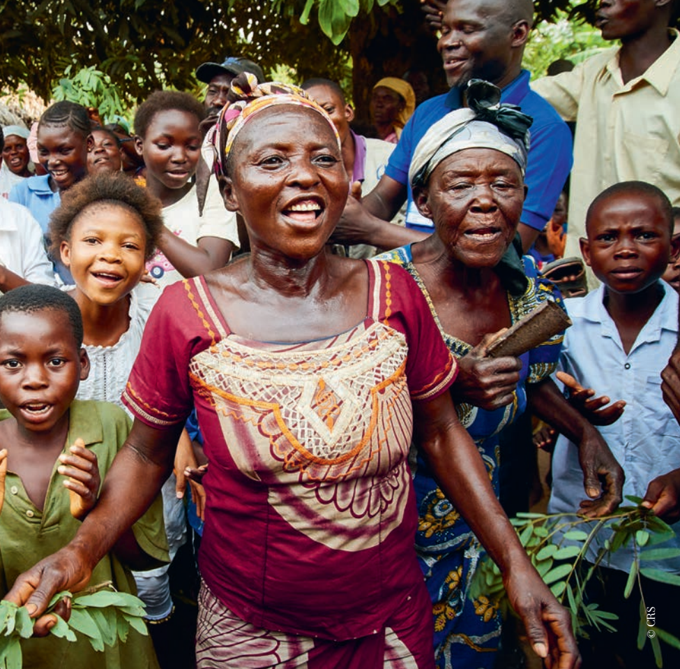
▲ Jong en oud verwelkomen een Caritas team in het dorp Bena Mabika in Oost-Kasaï.

genoot”, vertelt ze. Nu heb ik nog maar twee kinderen... ” Gewapende mannen vielen haar dorp aan in april. Haar man werd onthoofd, drie van haar kinderen vermoord. “Ik was toen in het ziekenhuis met